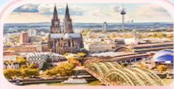
มหาวิหารโคโลญ