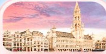
บรัสเซลส์