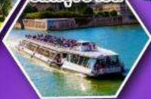
ล่องเรือบาโตมูช ชมกรุงปารีส

เที่ยวเมืองวาดุซ เมืองหลวงของสาธารณรัฐ ลิกเทนสไตน์