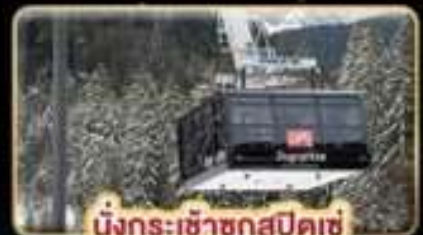
นั่งกระเช้าซุกสปีดเซ