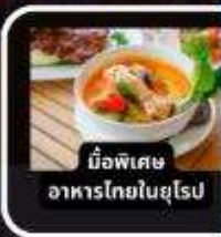
มือพิเศษ อาหารไทยในยุโรป