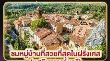
ชมหมู่บ้านที่สวยงามที่สุดในฝรั่งเศส (มูสติเยแซงก์มารี)