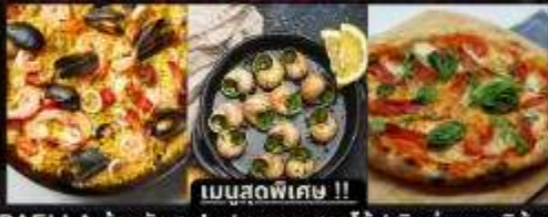
PAELLA ข้าวผัดสเปน / หอยเสกใส่ / พิซซ่ามากริด้า