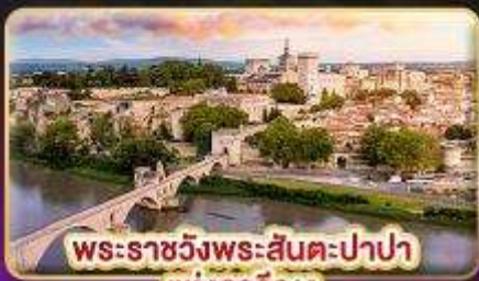
พระราชวังพระสันตะปาปา แห่งอเวัญ