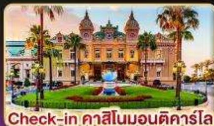
Check-in คาสีโนมอนติคาร์โล