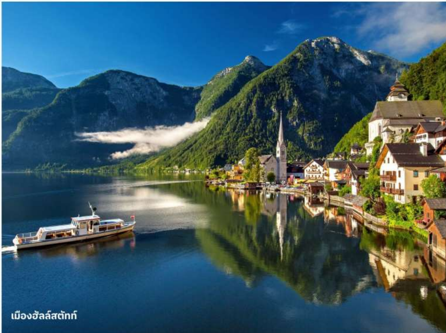
เมืองฮัลล์สตัดท์