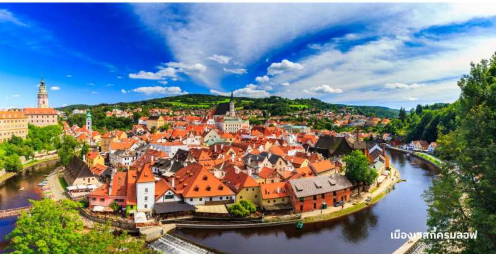
เมืองเชสกีครุมลอฟ

นำท่านเข้าสู่ที่พัก Hotel Bellevue Cesky Krumlov หรือเทียบเท่า