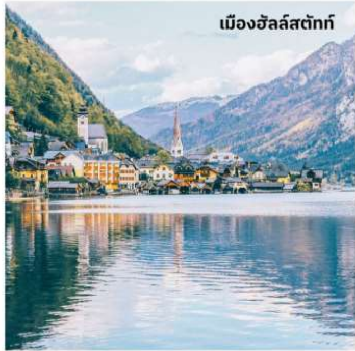
เมืองฮัลล์สตัดท์

ออสเตรียให้ฉายาเมืองนี้ว่าเป็นไข่มุกแห่งออสเตรีย และเป็นพื้นที่มรดกโลกของ UNESCO เพียงเดินเที่ยวชมเมืองก็เสมือนหนึ่งท่าน อยู่ในภวังค์แห่งความฝัน