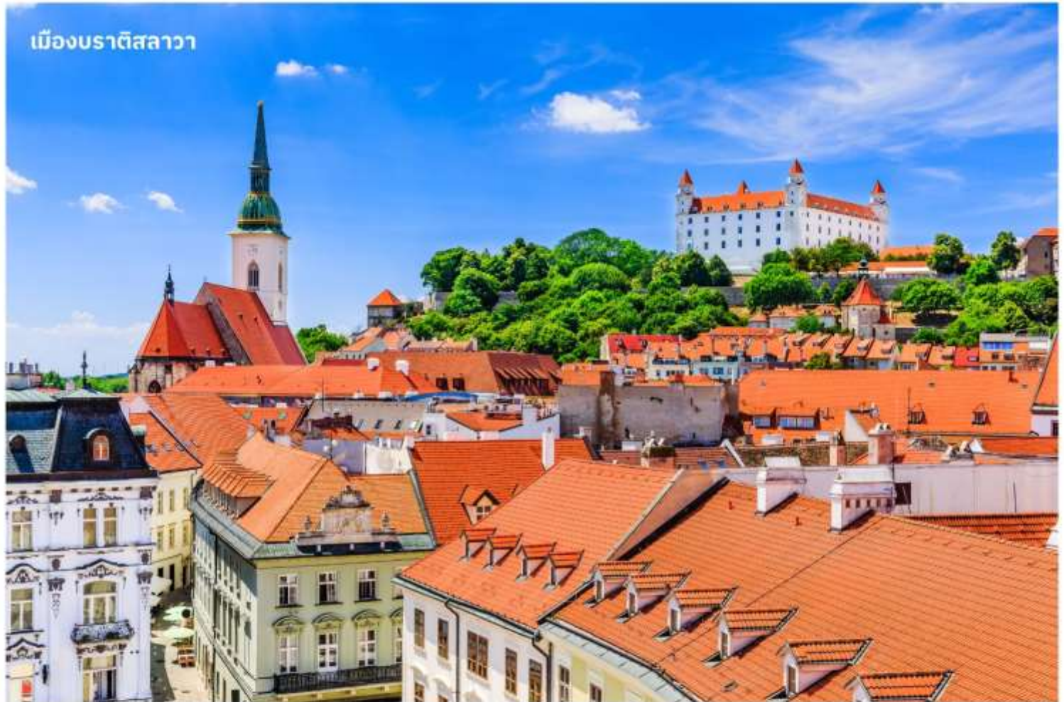
เมืองบราติสลาวา

จากนั้นนำท่านเดินทางสู่ เมืองบราติสลาวา ประเทศสโลวาเกีย ใช้เวลาเดินทางประมาณ 3 ชั่วโมง หรือมีชื่อเรียกอย่างเป็นทางการคือ สาธารณรัฐสโลวัก เป็นประเทศขนาดเล็กที่เพิ่งเข้าร่วมเป็นสมาชิกใหม่ของสหภาพยุโรป เป็นประเทศไม่มีทางออกสู่ทะเล แต่เมืองหลวงแห่งนี้เป็นเมืองที่มีชีวิตชีวาและยังเต็มไปด้วยวัฒนธรรมเก่าแก่ จากนั้นนำท่านถ่ายรูป ปราสาทบราติสลาวา ปราสาทเก่าแก่ที่ตั้งอยู่เหนือแม่น้ำดานูบ เมื่อขึ้นไปบนจุดที่ตั้งของปราสาทจะมองเห็นวิวทิวทัศน์เมืองสโลวาเกียได้ทั่วทั้งเมือง จากนั้นนำท่านเดินทางสู่ ย่านเมืองเก่าบราติสลาวา เป็นที่ตั้งของ ประตูมิคาเอล (Michael's Gate) เป็นประตูและป้อมปราการของเมืองเพียงแห่งเดียวที่ยังคงถูกเก็บรักษาไว้ตั้งแต่สมัยศตวรรษที่ 14