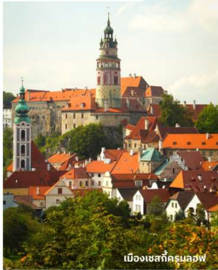
เมืองเชสกีครุมลอฟ

อิสระให้ท่านเดินเที่ยวชมเมืองโบราณตามอัธยาศัย