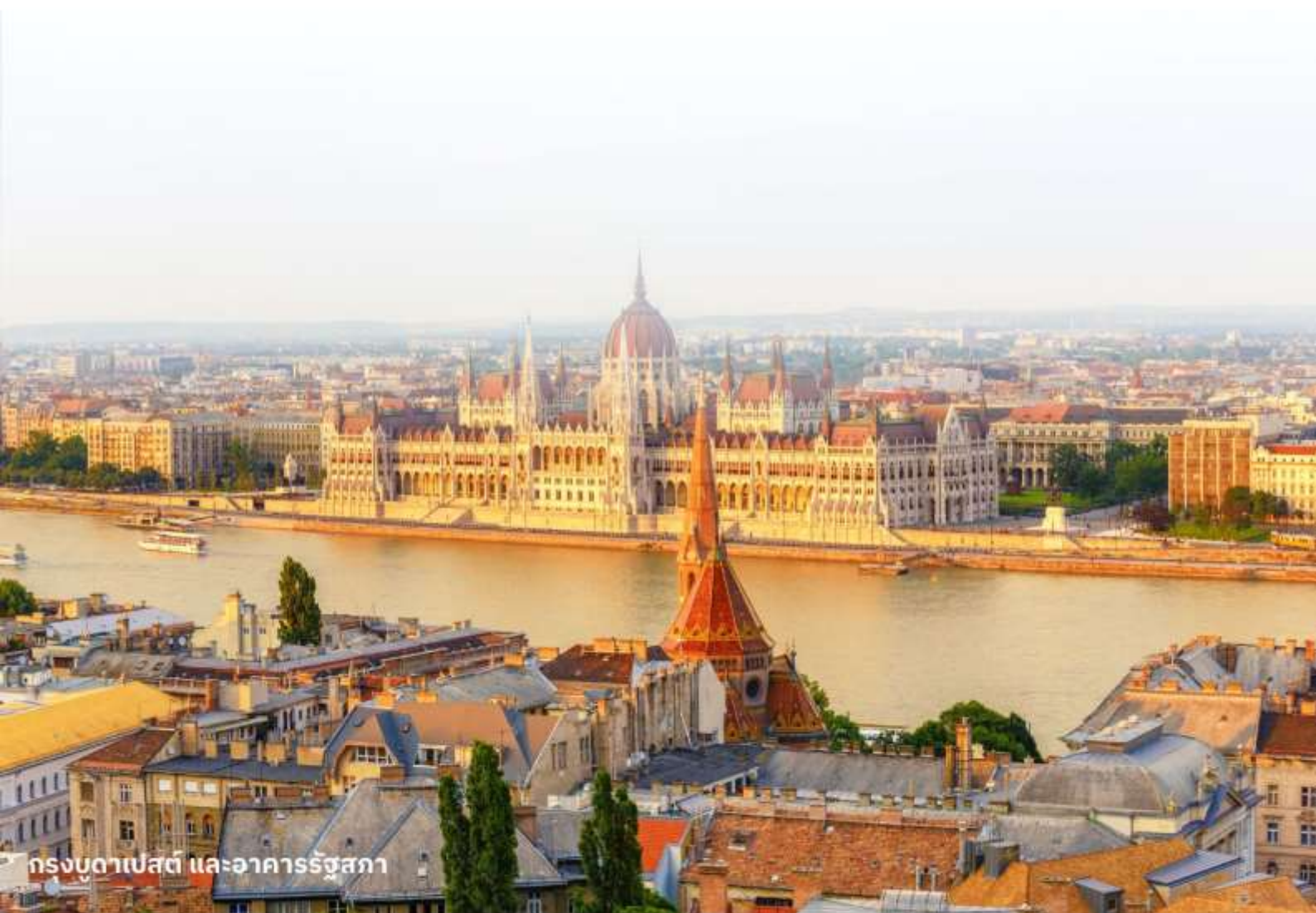
กรุงบูดาเปสต์ และอาคารรัฐสภา

นำท่านเข้าสู่ที่พัก Park Inn By Radisson Budapest หรือเทียบเท่า