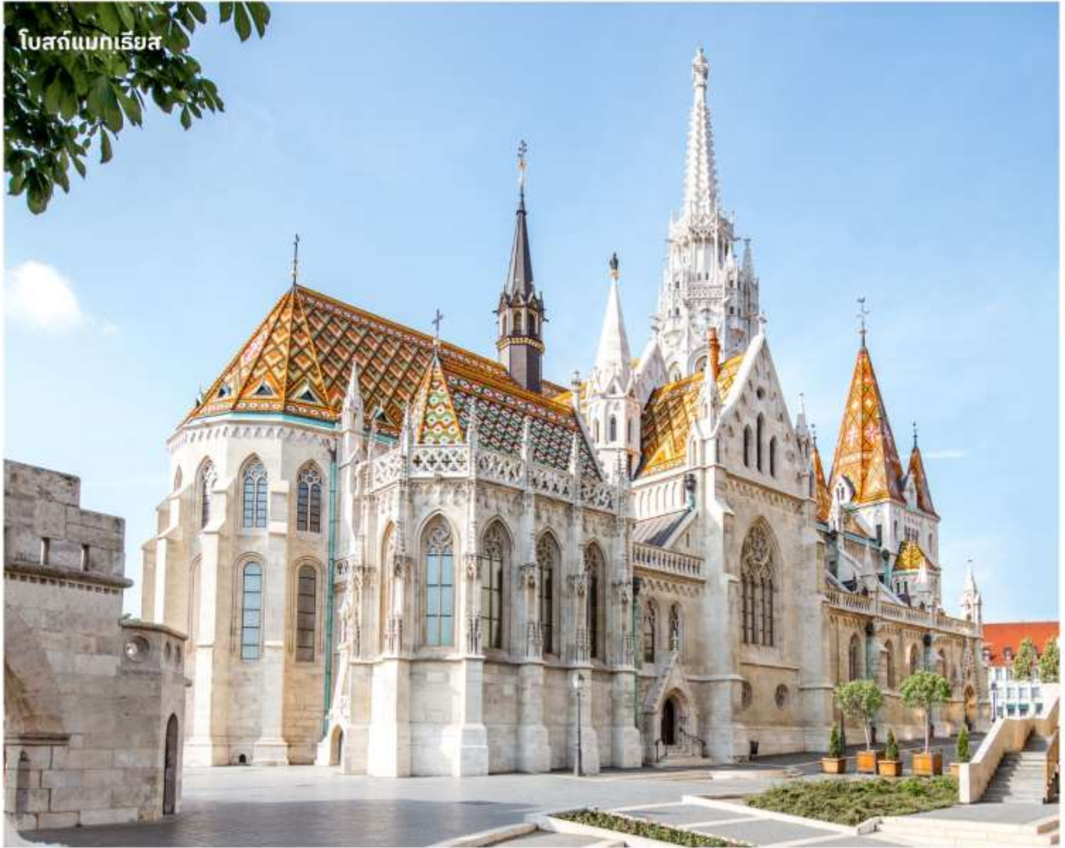
โบสถ์แมทเธียส

จากนั้นนำท่านชมบริเวณรอบนอก โบสถ์แมทเธียส (Matthias Church)