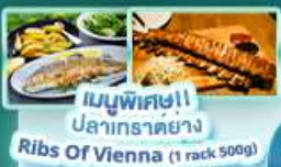
เมนูพิเศษ!! ปลากระต๊อ Ribs Of Vienna (1 rack 500g)