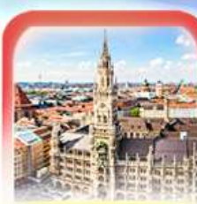
จัตุรัสมาเรียนพลัทซ์