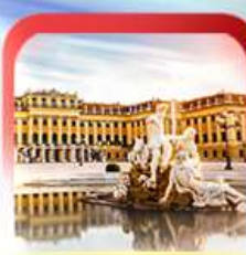
พระราชวังเชินบรุนน์