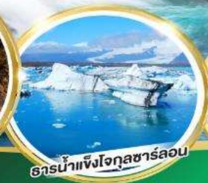
ธารน้ำแข็งโจกุลซาร์ลอน