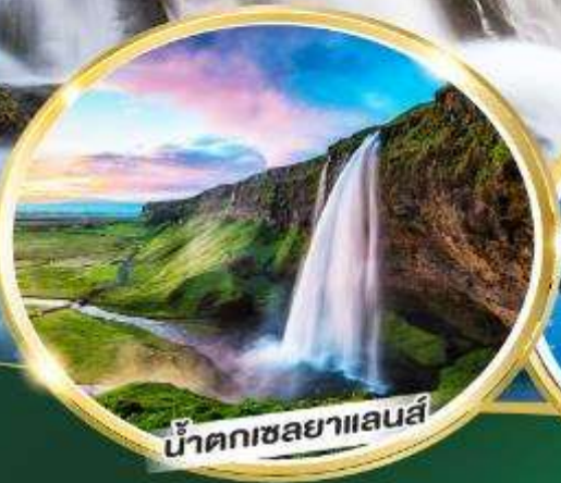
น้ำตกเซลยาแลนส์