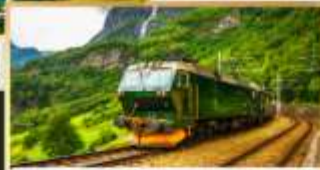
รถไฟสายฟลิมสบาน่า