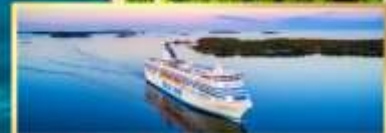
เรือ Tallink Silja Line