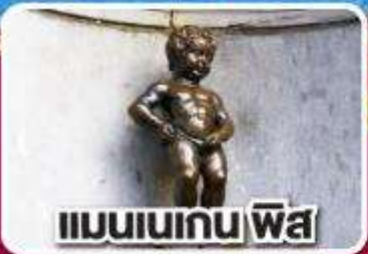
แมนเนเกน พิส