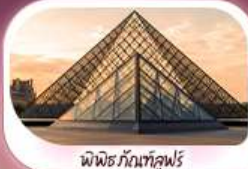
พิพิธภัณฑ์ลูฟร์