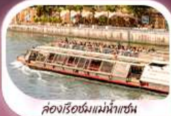
คองเรือชมแม่น้ำแซน