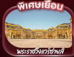
พิเศษเยือน