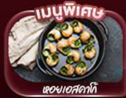
เมนูพิเศษ