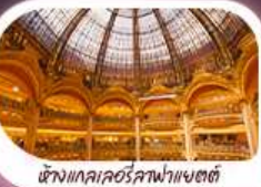
ห้างแลคซอร์คอฟาแซตต์