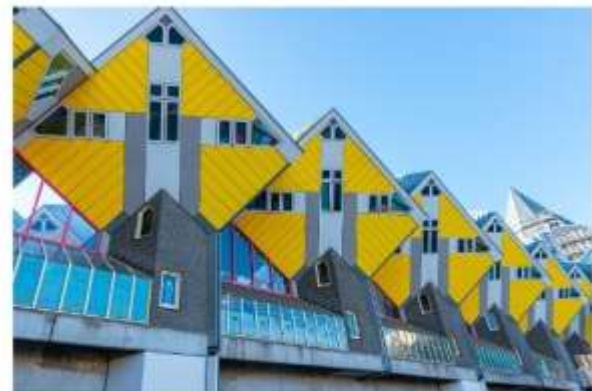
บ้านลูกเต๋าโค้คคุมูส

นำท่านถ่ายรูปกับ บ้านลูกเต๋าโค้คคุมูส (Kijk Kubus The Cubic Houses) กลุ่มอาคารเหล็องชาวทรงลูกเต๋า 39 หลัง ซึ่งได้รับรางวัลชนะเลิศการออกแบบสาขาประหยัดพลังงาน โดยสถาปนิกนาม Piet Bloem