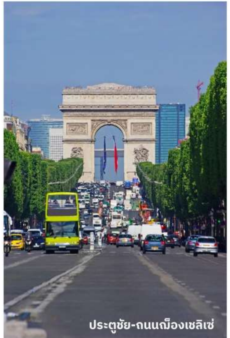
ประตูชัย-ถนนฌ็องเซลิเซ่

จากนั้นนำท่านเดินทางท่องเที่ยวตามสถานที่ที่มีชื่อเสียงของกรุงปารีส