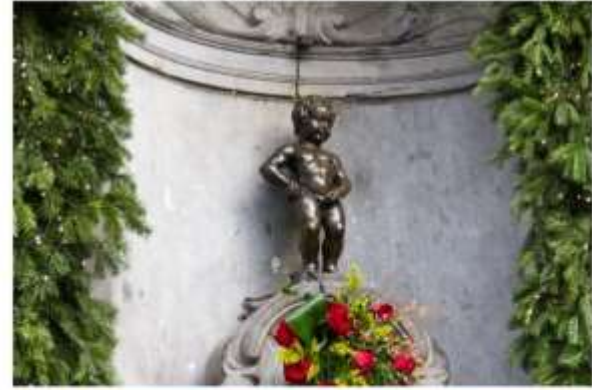
รูปปั้นแมนเนเก่นพิส

นำท่านไปชม รูปปั้นแมนเนเก่นพิส รูปปั้นเจ้าหนูน้อยที่โด่งดัง อิสระให้ท่านเดินเล่นชมเมืองหรือเลือกซื้อสินค้าของเมืองอาทิ ช็อคโกแลต เบลเยี่ยมผลิตช็อคโกแลตกว่า 172,000 ตันต่อปี และมีร้านขายช็อคโกแลต กว่า 2,000 ร้าน, ฝาปากลูกไม้ หรือลิ้มลองวาฟเฟิลของอร่อยที่หาชิมได้ไม่ยาก