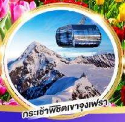
กระเช้าพิชิตเขาจุงเฟรา