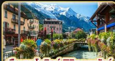
เยือนชาโมนิกซ์ พิชิตมงบลังก์