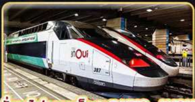
นั่งรถไฟความเร็วสูง PARIS - LYON