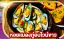
หอยแมลงภู่อบไวน์ขาว