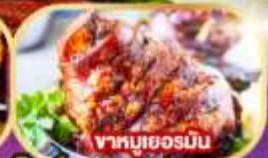
ซากหมูเยอรมัน

พิเศษ!! เมนูหอยแมลงภู่อบไวน์ขาวและซากหมูเยอรมัน