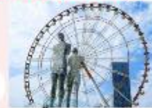
รูปปั้นอาลีและนีโน