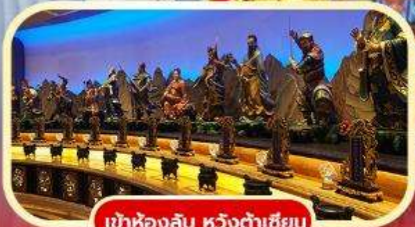
เข้าห้องลับ หวังต้าเซียน