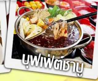
บุฟฟัตธาบู