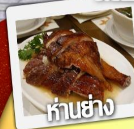
ก๋านย่าง