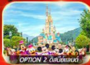
OPTION 2 ดิสนีย์แลนด์

เต็มอิ่ม ทั้งไหว้พระ-ขอพร การเงิน การงานความรักและซ่อมปัง