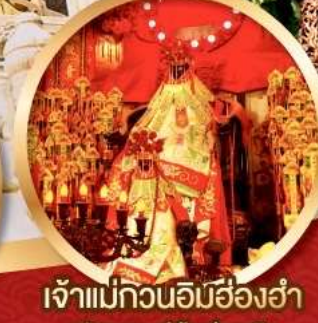
เจ้าแม่กวนอิมสี่องค์

นมัสการองค์เจ้าแม่กวนอิม อายุกว่า 600 ปี