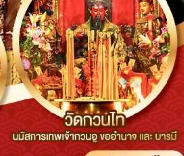
วัดกวนไท่

นมัสการองค์เจ้าแม่กวนอิม อายุกว่า 600 ปี