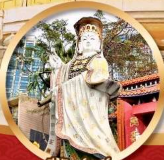
ริพัลส์เบย์