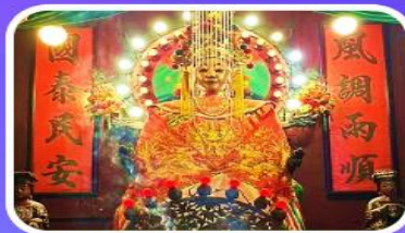
วัดเจ้าแม่กวนอิมเทียนหัว