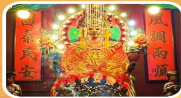
วัดเจ้าแม่กวนอิมเทียนทิว