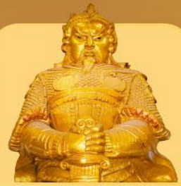
วัดแซงทมิว