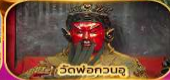
วัดพ่อกวนจู