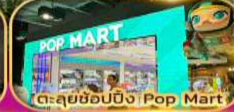
ตะลุยช้อปปิ้ง Pop Mart