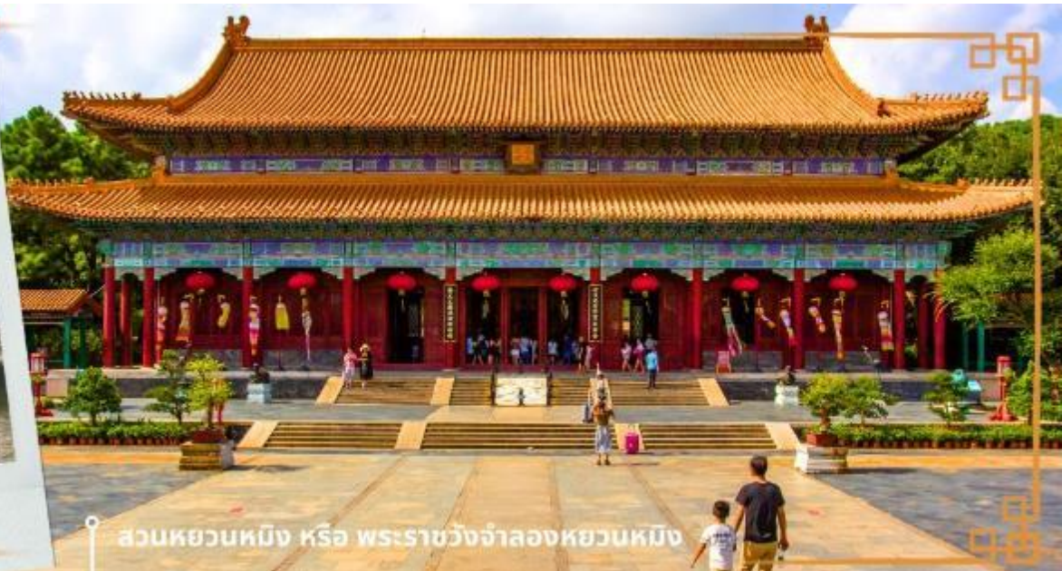
สวนหยวนหมิง หรือ พระราชวังจำลองหยวนหมิง