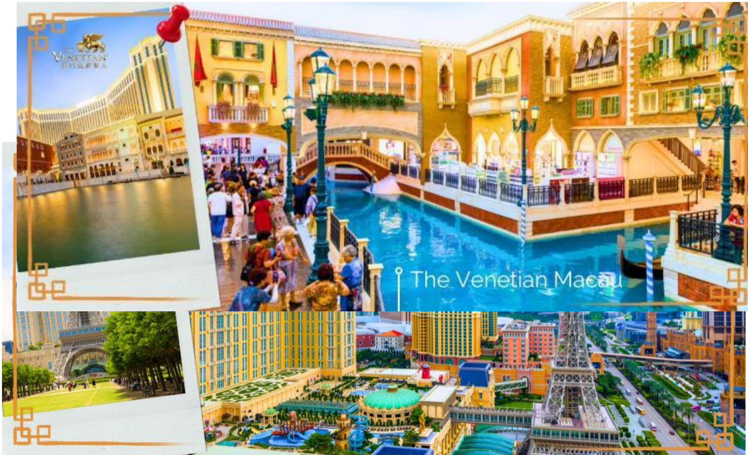
ที่วาดลวดลายเอาไว้อย่างวิจิตรงดงาม

จากนั้นนำท่านสู่ THE VENETIAN โรงแรมหรูในมาเก๊า ภายในมีห้องพักรับรองหลายพันห้อง มีห้องคอมพิวเตอร์ขนาดใหญ่ให้บริการ และมีกาสิโนที่นักพนันและนักท่องเที่ยวระดับไฮโซมาเล่นกันเพื่อความสนุกสนาน มากกว่าเล่นเพื่อผลกำไรเพียงเชิงอบายมุข ตลอดจนมีแหล่งจับจ่ายระดับโลกรวมอยู่ในที่เดียวกัน และยังมีเรือกอนโดลาบริการสำหรับผู้ต้องการล่องเรือในบรรยากาศเวนิสจำลองด้วยเช่นกัน ในส่วนที่เป็นตัวตึก ซึ่งเป็นที่ตั้งของโรงแรม และกาสิโนนั้น กินพื้นที่มากถึง 980,000 ตารางเมตร สูง 40 ชั้น ภายในตัวอาคารทั้งหมด ถูกออกแบบตามสไตล์อิตาลีเลียน และที่โดดเด่นที่สุด คือเพดาน