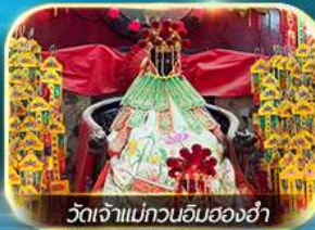
วัดเจ้าแม่กวนอิมของฮ่า