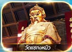
วัดเซกตงหมิว