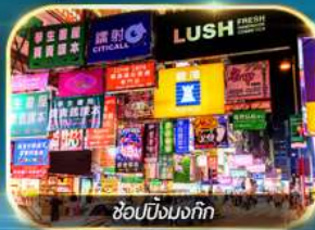
ช้อปปิ้งมงก๊ก

เต็มอิ่มทั้งบุญ และ ช้อปปิ้งแบบจัดเต็ม จิมซาจุ่ย มงก๊ก