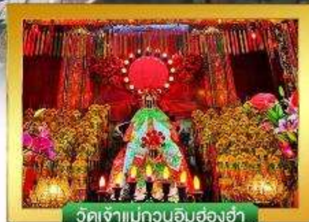
วัดเจ้าแม่กวนอิมฮ่องฮ่า