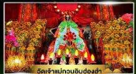
วัดเจ้าแม่กวนอิมฮ่องฮ่า