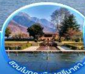
สวนโมกุล เมืองศรีนาคา

ตรีนาตา พาชาลแกรม กุลมาร์ต โซนามาร์ต 6 วัน 4 คืน