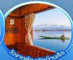
วิวจากห้องพักรับรอง