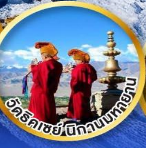
วัดธิคเซย์เชิกวานบเทยาบ