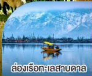
ล่องเรือทะเลสาบคาล