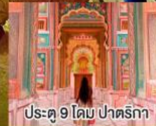
ประตู 9 โดม ปาตริกา