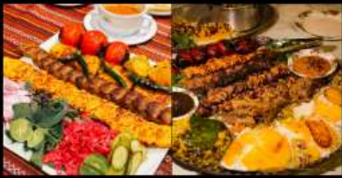
อาหารท้องถิ่นอิหร่านสุดพิเศษ