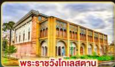
พระราชวังโกเลสถาน

เยือนอารยธรรมเปอร์เซีย เก็บครบทุกไฮไลต์สำคัญ