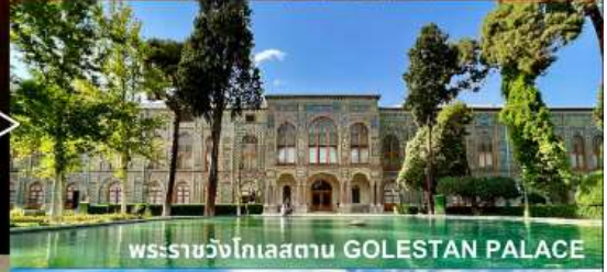
พระราชวังโกเลสถาน GOLESTAN PALACE