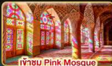
เข้าชม Pink Mosque