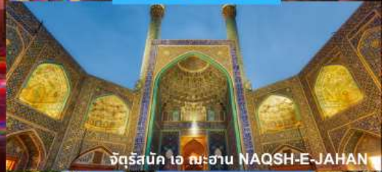
จัตุรัสบิก ไอ ฉะฮาน NAQSH-E-JAHAN