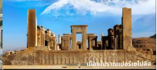
เมืองโบราณเปอร์เซโปลิส