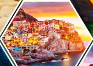
หมู่บ้านมาราโรลา