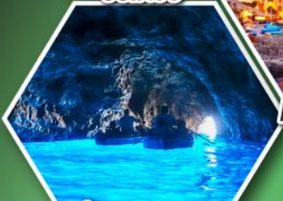
ถ้ำลูกรोटโต้