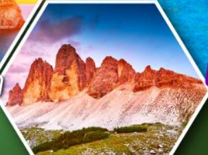
โตโลไมท์