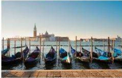
เรือกอนโดลา

นำท่านออกเดินทางสู่ ท่าเรือตรอนเคโตโต้ เพื่อเตรียมตัวนั่งเรือข้ามสู่เกาะเวนิส เกาะเวนิสเป็นดินแดนแสนโรแมนติก เป็นเมืองที่ไม่เหมือนใคร โดยใช้เรือแทนรถ ใช้คลองแทนถนน มีสมญานามว่าเป็น “ราชินีแห่งทะเลเอเดรียติก” มีเกาะน้อยใหญ่กว่า 118 เกาะและมีสะพานเชื่อมถึงกัน กว่า 400 แห่ง