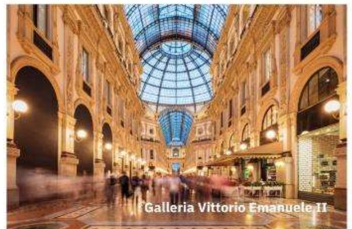
Galleria Vittorio Emanuele II

อิสระช้อปปิ้ง ที่ Galleria Vittorio Emanuele II ที่ตั้งอยู่ทางฝั่งขวาของมหาวิหารมิลาน เป็นห้างสรรพสินค้าที่เก่าแก่ที่สุดในอิตาลี โดยสร้างขึ้นในปี 1877 มากมายด้วยร้านค้า ร้านอาหาร จุดเด่นของอาคารก็คือหลังคาทรงโดมเป็นกระจกใส ทำให้สามารถช้อปปิ้งได้ในทุกสภาพอากาศ ได้เวลาอันสมควรนำท่านสู่สนามบิน