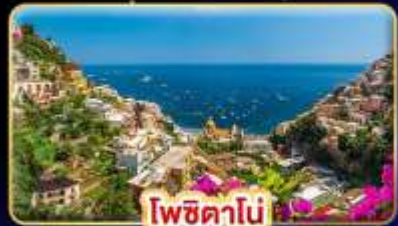
โพซิทานิ