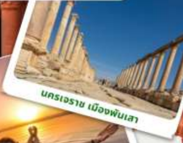
นครเจราซ เมืองพันเสา