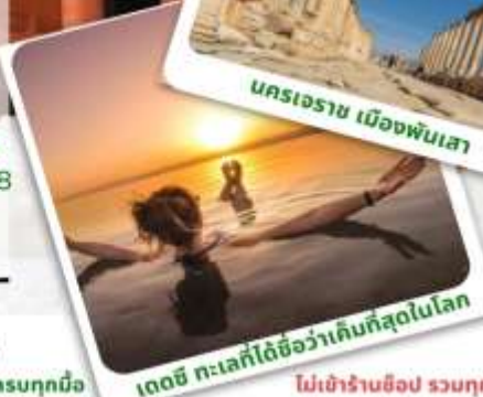
เดดซี ทะเลที่เค็มที่สุดในโลก