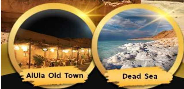
AlUla Old Town