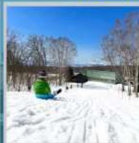
"NISEKO SKI RESORT"