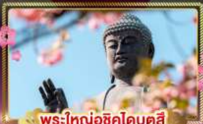
พระใหญ่อุซึคุโดบุคสี