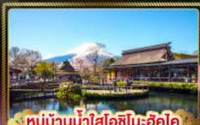
หมู่บ้านน้ำใสโอชิโนะฮักโค