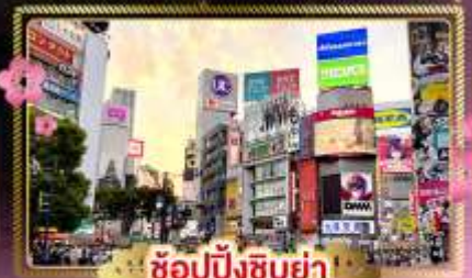
ช้อปปิ้งชิบูย่า