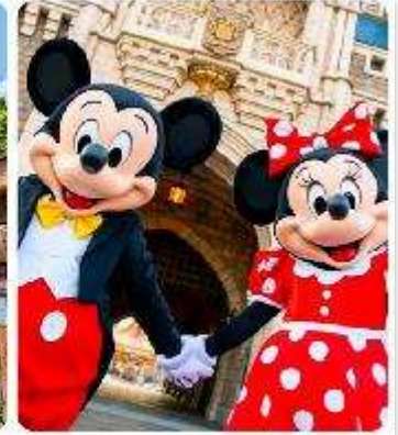
โตเกียวดิสนีย์แลนด์

แนะนำที่เที่ยว อิสระด้วยตัวเองเต็มวัน ! เลือกซื้อทัวร์เสริมอิสระดิสนีย์แลนด์ (ไม่มีหัวหน้าทัวร์และไม่มีไกด์นำเที่ยว) เอาใจแฟนพันธุ์แท้ของดิสนีย์ กับ สวนสนุกโตเกียวดิสนีย์แลนด์ ที่เต็มไปด้วยการผจญภัย ความสนุกสนานในโลกลึกลับเมื่อดำเนินทางเข้าสู่ สวนสนุกโตเกียวดิสนีย์แลนด์ จะพบกับธีมพาร์คที่ แบ่งออกเป็น หลากหลาย เช่น Adventureland ที่เต็มไปด้วยการผจญภัยในป่าและน้ำตก, Fantasyland ดินแดนของตัวละครดิสนีย์ที่คุณหลงใหล, และ Tomorrowland ที่จะพาคุณไปสำรวจอนาคตที่เต็มไปด้วยนวัตกรรม และเปิดประสบการณ์ใหม่ที่ Tokyo Disney Sea ที่จะพาคุณไปผจญภัยยังโลกทะเลและการผจญภัยทางน้ำ นอกจากนี้เรายังเพลิดเพลินกับร้านอาหารและคาเฟ่รวมไปถึงของฝากจากดิสนีย์อีกมาย (ค่าทัวร์ยังไม่รวมบัตรค่าเข้า)