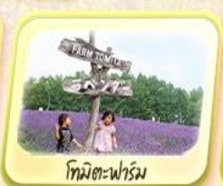
โทมิตะฟาร์ม