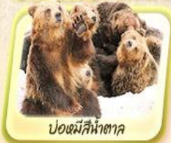
บ่อหมีสีน้ำตาล