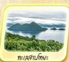
ทะเลสาบโทยะ