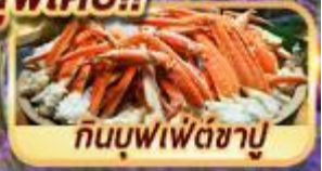
กินบุฟเฟ่ต์ชาบู