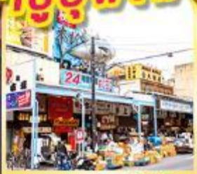
ตลาดปลาชิทิจิ