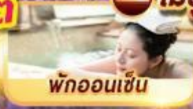
พักผ่อนเซ็น