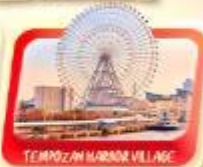
TEMPOZAN HARBOR VILLAGE