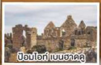
ป้อมโอ๊ก์ เบนฮาดดู