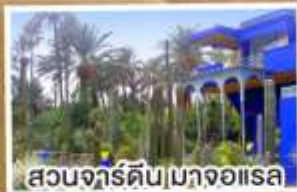
สวนจาร์ดิน|มาจอาเรล