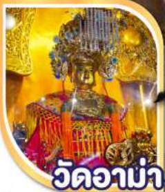
วัดอาน่า