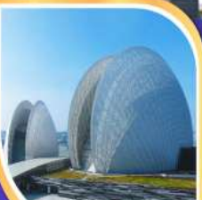
โรงละครหอยโข่งบุก