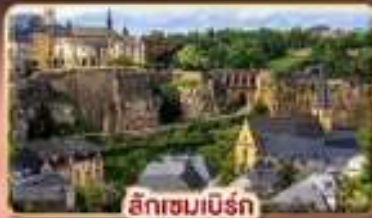
ลักเซมเบิร์ก