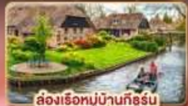
ล่องเรือหมู่บ้านกังหัน