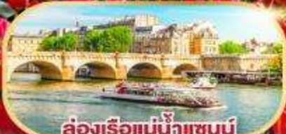
ล่องเรือแม่น้ำแชนน์