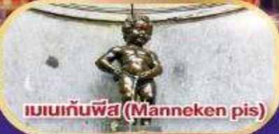
แมนกันพีส (Manneken pis)