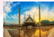
มัสยิดไฟซาล

DAY8 ตักศิลา-พิพิธภัณฑ์ตักศิลา-อิสลามาบัด-มัสยิดไฟซาล-Shopping-กรุงเทพ