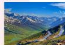
หุบเขา Naran Kaghan

** พักที่ Besham Hilton Hotel หรือเทียบเท่า **