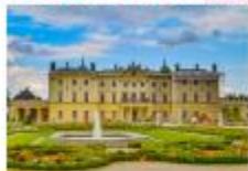
พระราชวัง Branicki