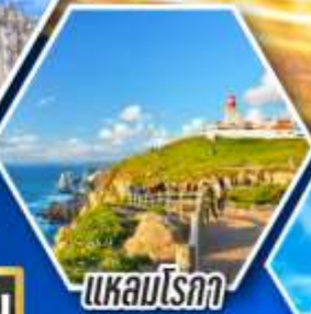
แหลมโรกา