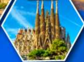
โบสถ์ซากราดา แฟมิลีย