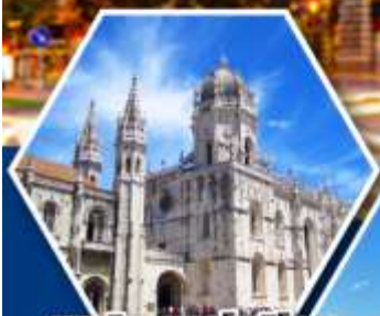
มหาวิหารเจอโรนีนีโม