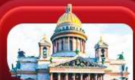
มหาวิหารเซนต์ไอแซค